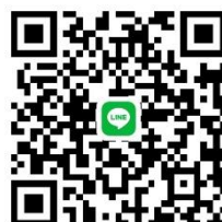
0428滾球大集合 line 群組